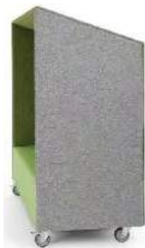
QD SHA R

Tkaniny z kolekcji Studio Design (symbol SD) - wydłużony termin realizacji