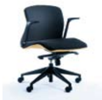
LINUS 20 Z czarny PU