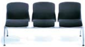
LINUS L3 metalik Zestaw występuje z 2 lub 3 siedziskami Set available with 2 or 3 seats