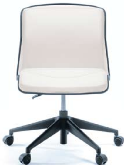
LINUS 20 E czarny

Regulacja wysokości siedziska Adjustment of the seat height