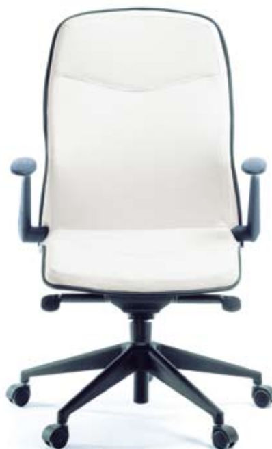
LINUS 10 Z czarny PU