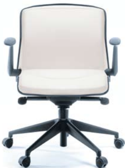
LINUS 20 Z czarny PU

All models with castors presented here (standard) are available also in version with feet (option)