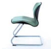
LINUS 20 V metalik Wersja konferencyjna na metalowej płozie Conference version with a metal cantilever