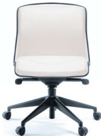
LINUS 20 Z czarny

Mechanism of the height and tilt angle adjustment of a backrest and a seat