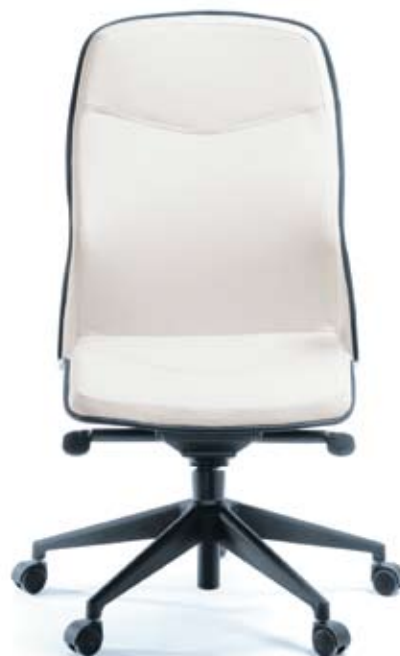
LINUS 10 Z czarny