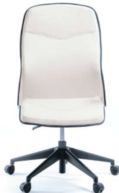
LINUS 10 E czarny