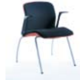
LINUS 20 H metalik PU Wersja konferencyjna na metalowych nogach Conference version with metal legs