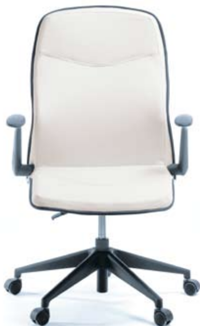
LINUS 10 E czarny PU